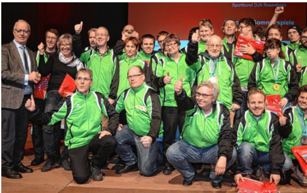
Große Freude bei den geehrten Handicap-Sportlern für ihre Erfolge.